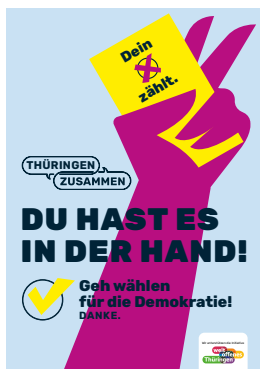
Du hast es in der Hand. Geh wählen für die Demokratie!