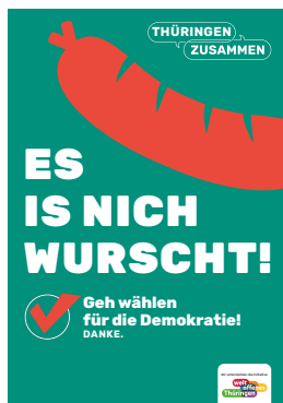
Es is nich wurscht! Geh wählen für die Demokratie!